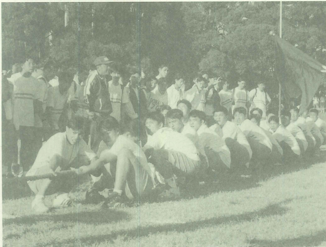
人生就像一場場現實與理想的拉鋸戰(陳玉嬪攝)

如上所述應該是道理淺顯、簡單易行，其中關鍵只在「恆心」。教育本來就是生活，有恆心的力行之，父母的目標本就在於指導子女過一個成功健康的生活。